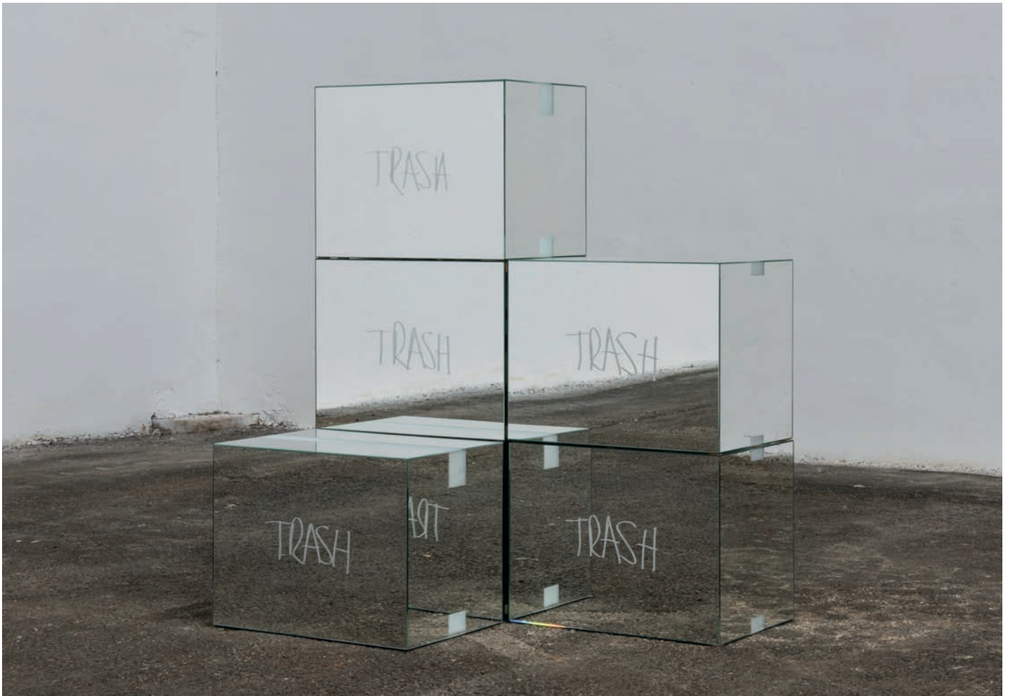
Stefan Brüggemann: Trash Mirror Boxes (After MV) , 2015. Cattelain Collection