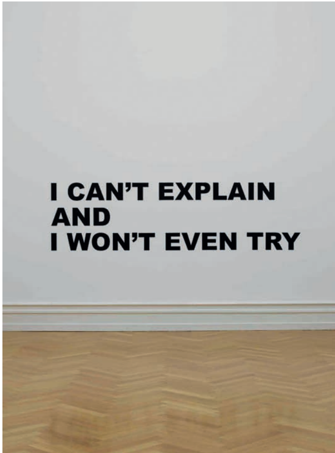
Stefan Brüggemann: I CAN'T EXPLAIN AND I WON'T EVEN TRY , 2003.

SB: I think it is a little bit all of these and also it is the first word you learn that displays a position. The first time you say 'no' is because you have a position in the world, to learn a position. You decide. You disagree. But it also enables transformation. Even if it is a negative position, it can create something new. The word is more positive than negative because it generates something.