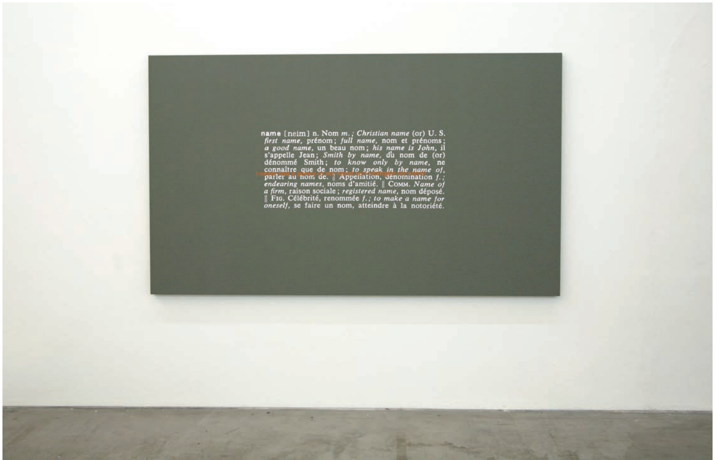
Stefan Brüggemann: Sen título (Joke and Definition Painting) , 2011.

SB: Hoxe en día estamos deconstruídos. Temos un pouco de todo, como se mesturásemos todas as cores e logo lles désemos unha forma conxunta. Basicamente, hai un pouco de todo. Incluso o concepto recorrente do punk : a xente que vemos pola rúa con crista non a clasificamos como punk . Os verdadeiros punks son os brokers do mercado de valores, pois as súas accións son o que o está a destruír todo. Hoxe os verdadeiros punks levan quizais traxe e gravata, os que son iconoclastas e individualistas nunha época de conformismo.