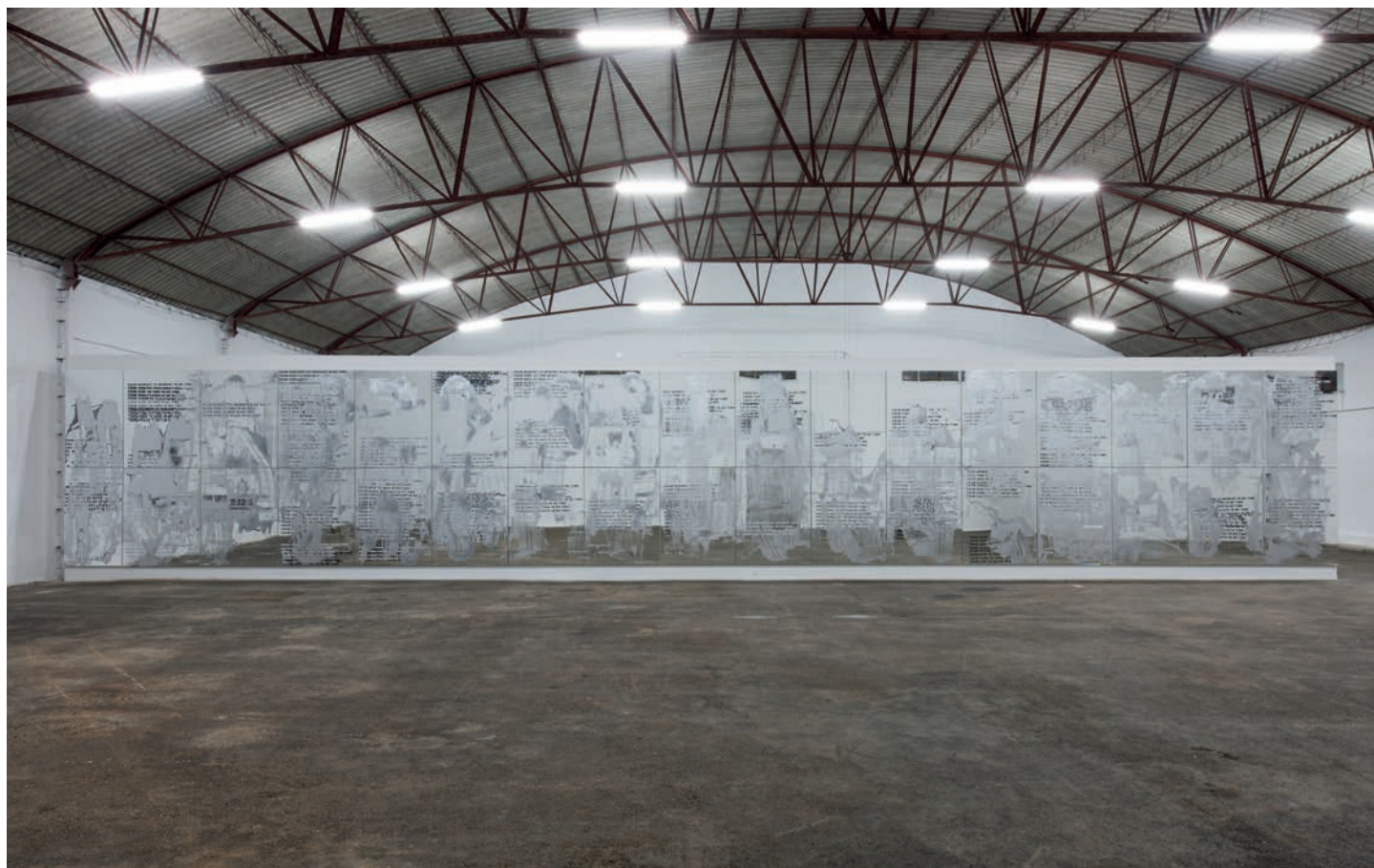
Stefan Brüggemann: Timeless , 2016.

JS: Hoy en día la mayoría de las posiciones que provienen de tendencias culturales y sociales han dejado de ser lineales o radicales , aunque a veces combinan cosas que habían sido justo su opuesto. O estás a la derecha o estás a la izquierda, pero no puedes estar en los dos lados.