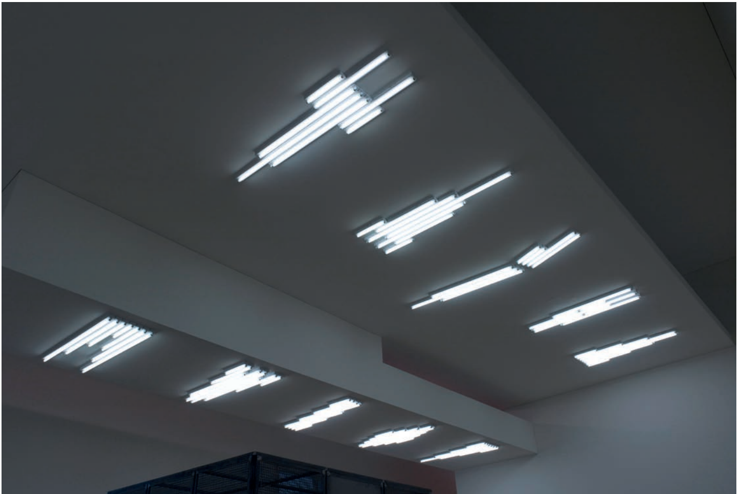
Stefan Brüggemann: Monuments for the Ceiling IX , 2010.

JS: You have mentioned the fact that you often use the word 'no.' It can be seen as a form of nihilism, anti-conformism, something provocative or cynical.